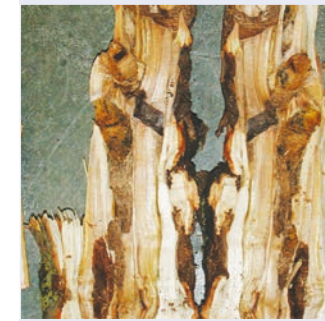
10. Breite Fraßgänge des ALB im Holzkörper