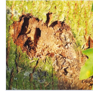
8. Larvenfraß unter der Rinde mit ovalem Einbohrloch der Larve