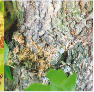
9. Von Larve ausgeworfene grobe Nagespäne