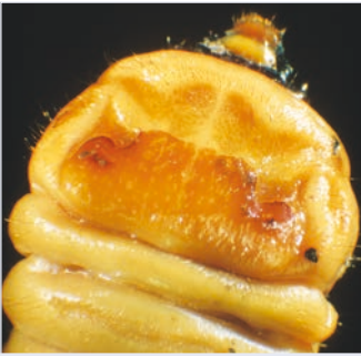
2. Larve mit typischem Halsschild