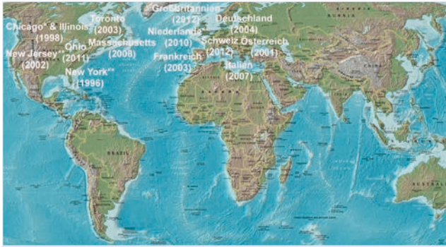
12. Jahr der Erstfunde des ALB unter Freilandbedingungen außerhalb seines Heimatgebietes in Asien (*ganz oder **teilweise ausgerottet)