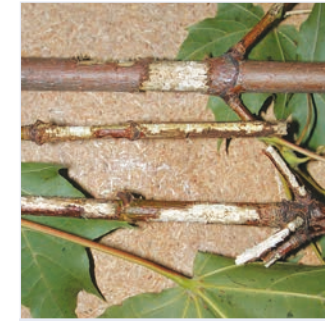
6. Reifungsfraß der Käfer an Ästen

Ausbohrlöcher: charakteristisch kreisrund, Durchmesser 1 - 1,5 cm (11).