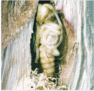
3. Puppe mit grobem Spanpolster in Puppenwiege