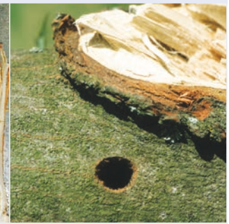
11. Kreisrundes Ausbohrloch

Befallssymptome sind an jungen Bäumen verhältnismäßig gut aufzuspüren. Bei Altbäumen mit dichtem Laub gibt letztlich nur die Inspektion in der Krone selbst, z. B. bei Baumpflegearbeiten, eine ausreichende Sicherheit. Selbst äußerlich vital erscheinende Bäume können Larven oder fertig entwickelte, schlupfbereite Käfer beherbergen.