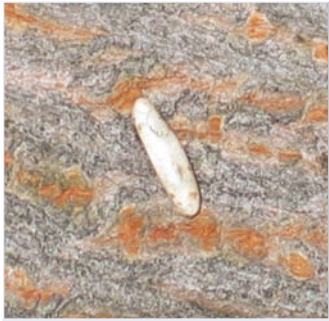
1. Reiskorngroßes Ei (7-8 mm)