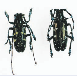
4. Erwachsene ALB, links Männchen, rechts Weibchen